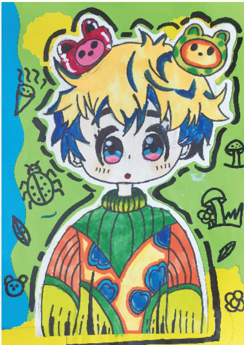
小记者:王一诺 二(5)班 辅导老师:张玲会