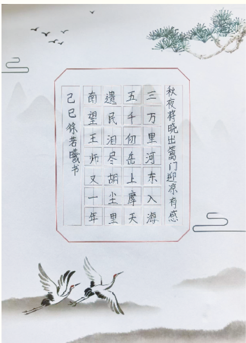
小记者:徐若曦 五(5)班 辅导老师:张玲会