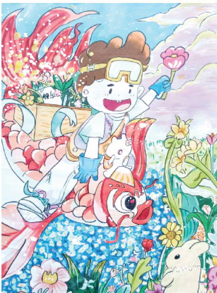
小记者:熊思晗 三(6)班 辅导老师:王竣钰