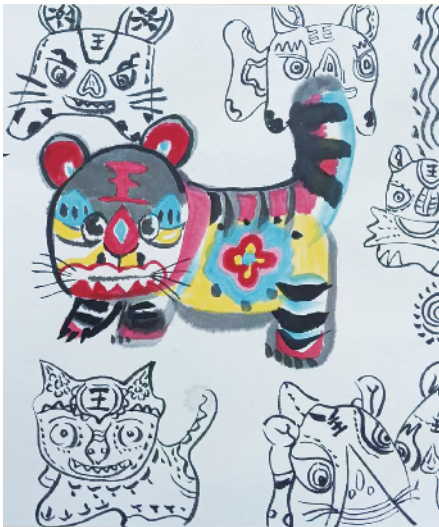
小记者:刘柘溪 三(6)班 辅导老师:王竣钰